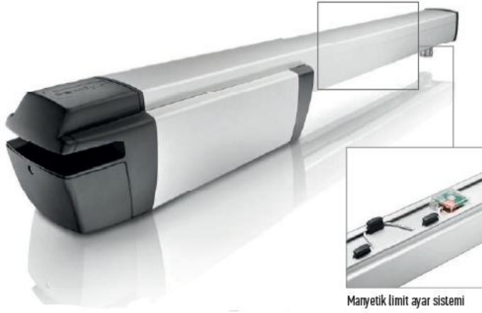
Manyetik limit ayar sistemi